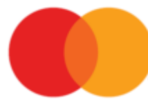
Эмблема после января 2019

Эмблема Mastercard представляет собой два круга красного (слева) и желтого (справа) цветов, пересекающиеся вдоль горизонтальной оси примерно на одну треть диаметра;